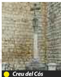
● Creu del Cós