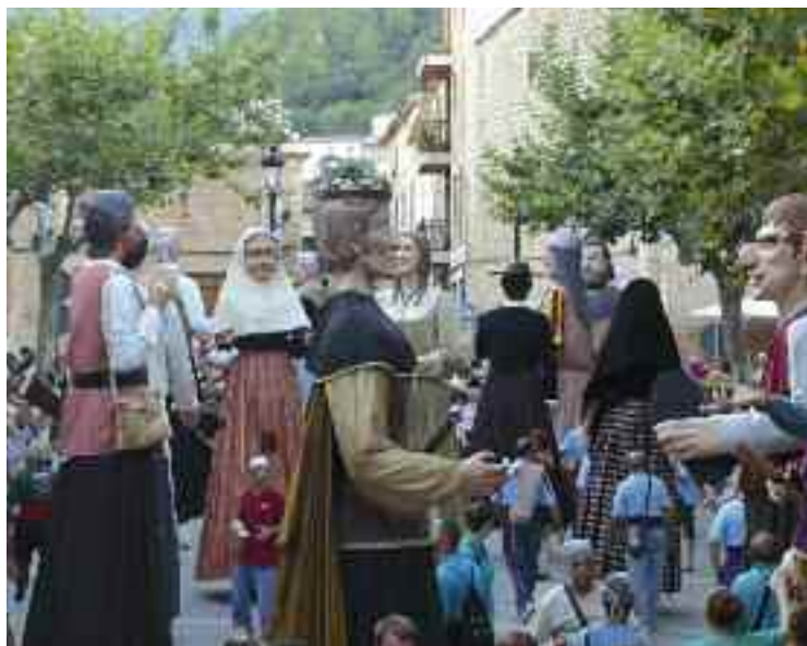
Trobada de gegants durant les festes de Sant Roc