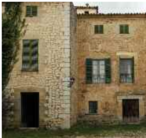
Façana de Son Curt

A partir d'aquest punt el traçat original del camí es desdibuixa en part. El camí primigeni acurça, per les dreceres, la pista de fergigó, la més utilitzada habitualment.