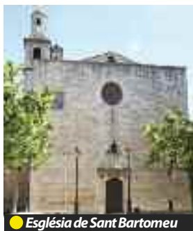
● Església de Sant Bartomeu