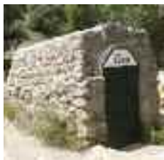
L'aigua de la font de ses Artigues arriba a través d'una síquia fins a Alaró