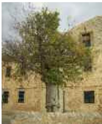
Lledoner de sa Bastida

Conjunt de plàtans ( Platanus orientalis ) d'un diàmetre i alçària considerables. Es troben en terreny públic, a l'escorxador municipal reconvertit en