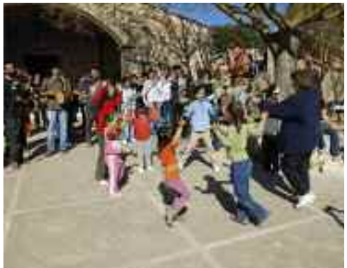
Celebració de la festa de l'Àngel o pancaritat

Molt a prop d'aquesta última talaia hi ha la boca de la cova de Sant Antoni , encara que no cal esperar cap cartell que ho anunciï. Aquesta impressionant obertura irregu-