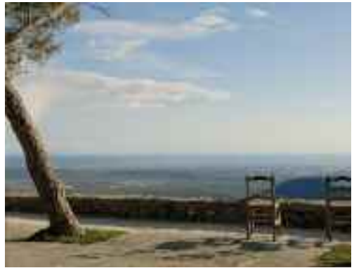
Mirador des del qual es divisa el sud de Mallorca

Com era habitual a les fortificacions medievals, el castell comptava amb una capella gòtica, per poder complir les obliga-