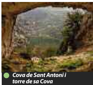
● Cova de Sant Antoni i torre de sa Cova