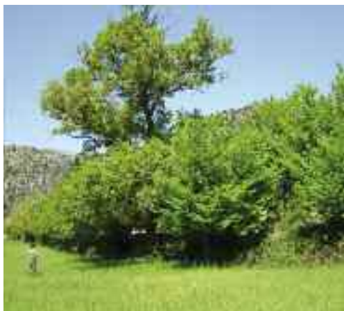
Om de la Casa d'Amunt

Destacat conjunt d'arbres de galeria o de ribera, molt escassos en el municipi d'Alaró: polls ( Popu-