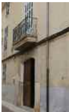
Can Bereiol, seu de la fàbrica de l'Electricitat (edifici situat devora la Torre)

de forma troncopiramidal, units per una escala. A l'apartat «Alaró poble de pioners» es descriu aquest capítol de la història alaronera (pàg. 11)