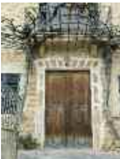
Porta del casal de sa Bastida

Proseguint el recorregut s'abandona la placeta girant a mà esquerra pel carrer de Son Borràs, i s'arriba davant la propietat que dona nom a la via en els números 9 i 11. Es tracta d'un casal del final del segle XVI o el principi del XVII que, segons fonts