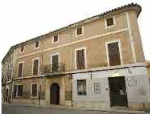
Posada de Bànyols