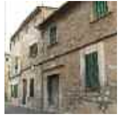
Típic casal senyorial del segle XVII situat al carrer de Can Palou i avui dividit en tres habitatges

taquen un magnífic portal de pedra i una creu de marès encastada a la façana principal.