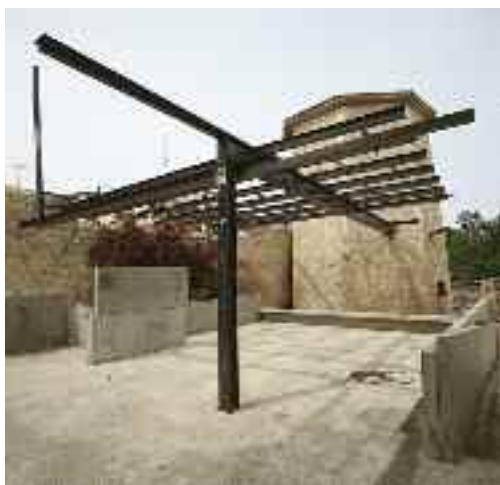
Torre de l'Electricitat