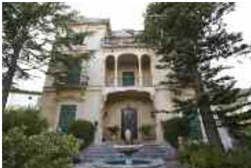
Casal de Can Jaumico

tals i, igual que la pareteta de tancament, una reixa amb motius florals, els mateixos que podem trobar en el 25 del carrer de can Cladera.