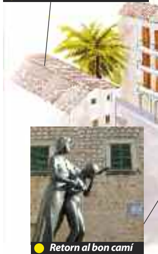
● Retorn al bon camí

de l'església, definida per grans volums de pedra nua desornamentats, on els únics elements que destaquen a l'exterior són la rosassa i el portal major, molt habitual en l'arquitectura religiosa del