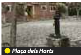
● Plaça dels Horts