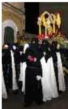
Processó de Setmana Santa

Les imatges que recorren els carrers són talles originals del segle XVIII.