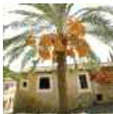
A Son Bieló hi ha vestigis dels antics molins d'aigua del poble

girant a mà esquerra, al passatge de sa Gerreteria , un racó preciós per explorar, dels molts que es poden trobar al nucli antic. Es reprèn el carrer de Son Sitges per dirigir-se a Son Bieló (c. de Son Sitges, 11), un casal que tenia un altre dels molins d'aigua –del qual resten vestigis–, que, com l'anterior, formava part de l'antic sistema hidràulic d'Alaró. Aquest casal del segle XVIII exhibeix un