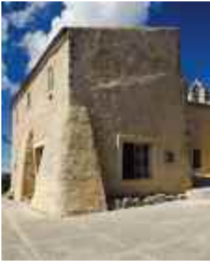
Edifici de l'hostatgeria