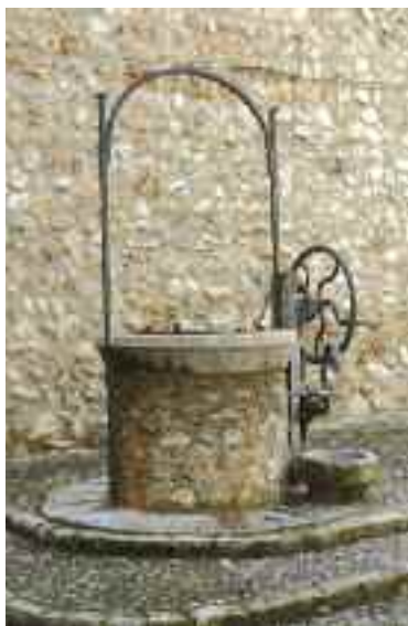
Manxa del carrer de Can Manyoles

Aquests molins han sofert transformacions amb els anys, fins i tot algun es va adaptar per transformar-se en fàbrica paperera a la fi del segle XIX i començament del XX. Actualment molts han desaparegut per abandonament o s'han reconvertit a usos nous.