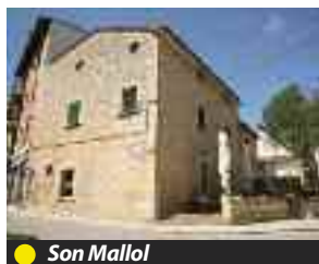
● Son Mallol

Des de la plaça s'aprecia la façana principal