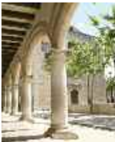
Pòrtics de l'Ajuntament

L'antic Ajuntament (un edifici barroc que es localitzava davant l'actual) ocupava l'espai de l'actual plaça de la Vila.