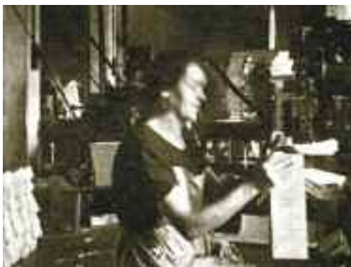
Activitat a la fàbrica de sabates de Can Fullana

Una indústria del municipi va despuntar ràpidament: el calçat, que comença a reemplaçar l'agricultura com a principal ocupació de la població. A