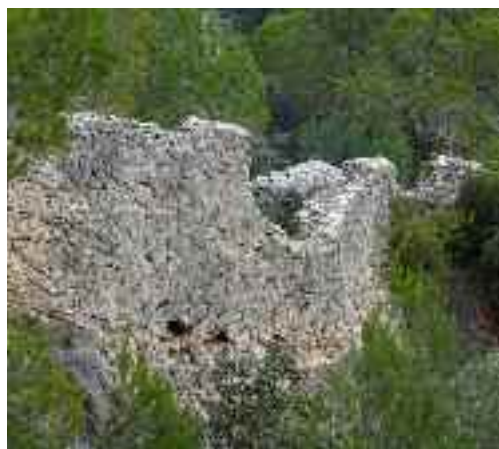
Restes de la murada de la fortificació de sa Bastida

Un dels elements més significatius que es conserva de l'època àrab a Alaró és el qanat o font de ses Artigues, el seu pou original i part del traçat de la síquia.