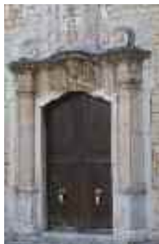
Portal principal del temple

La rosassa circular és de traceria gòtica i a la seva esquerra hi ha un rellotge emmarcat en fusta i pedra. Sobre el rellotge