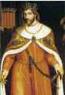
Jaume I el Conqueridor

D'altra banda, mentre els musulmans dominaven les illes, les aigües i costes del Mediterrani occidental no eren segures i