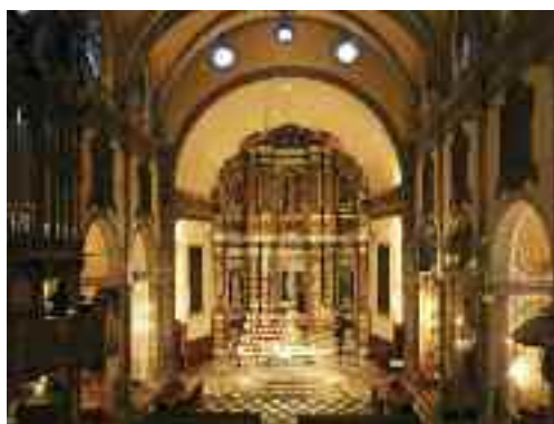
Altar major de l'església, elaborat en marbre

tistes que triaren Alaró per instal·lar-s'hi.