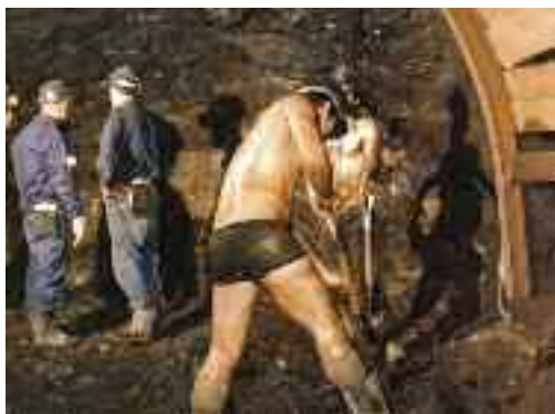
Interior de les mines de lignit

vament al consum de les centrals tèrmiques. El 1988 el nombre de jaciments en funcionament havia descendit considerablement, fins que un any més tard es va paralitzar l'extracció de lignit per falta de rendibilitat.