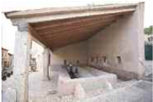
Rentadors del Pontarró

Continuant amb el recorregut del carrer del Pontarró, unes altres bugaderies públiques, els rentadors del Pontarró , del segle XIX, formats per un abeurador i una pica rectangular per rentar-hi, construïts de pedra i emblanquinats, davall