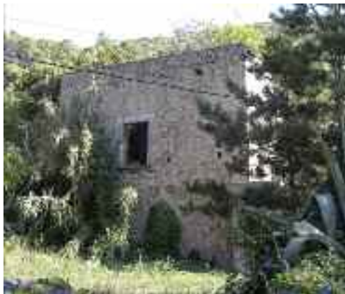
Molí de sa Font

metàl·lica, malgrat que encara drena aigua. Només ha sobreviscut part del molí, la resta s'ha esbucada, però encara se'n distingeixen restes de la síquia.