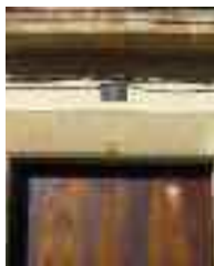
La lletra Tau esgrafuada a un portal

Entre les característiques que defineixen la majoria dels portals principals d'Alaró, hi ha les llindes de gran entitat, lloses de pedra en els sòcols i marès o pedra en els marcs d'obertures i llindars. En alguns casos, s'hi ha esgrafiat una creu al centre o lateral, o la lletra grega tau, símbol de sant Antoni Abad.