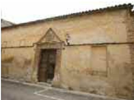
Façana exterior de la Rectoria

ment es pot apreciar el portal neoclàssic d'inspiració protorenaixentista que ha arribat intacte fins a avui: una gran porta allindanada tallada en pedra rematada en un