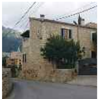
Son Sant Joan

l'alqueria de Son Sant Joan, haureu de tornar fins a l'escola, i continuar pel carrer de Pere Rosselló Oliver (carrer dedicat al batle republicà afusellat durant la Guerra Civil) i girar a la dreta en el carrer de Son Amengual, per poder apreciar un nou exemple d'habitatge modernista, es Casats o els Casals (c. de Son Amengual, 26). Aquest edifici apareix aïllat de la resta d'edificis amb zona enjar-