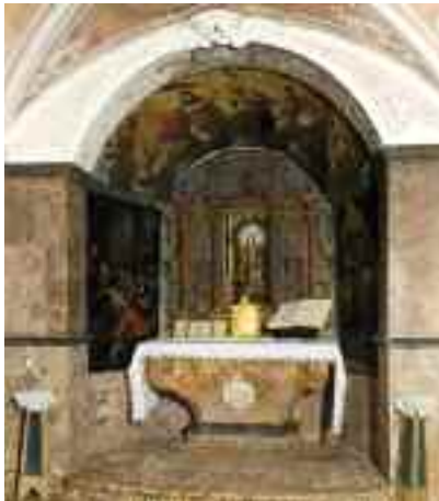
Oratori de la Mare de Déu del Refugi

Bassa i la quantiosa col·lecció d'exvots dedicats a la imatge de la Mare de Déu. El 1622 a l'edificació original s'hi afegiren la capella i la sagristia.