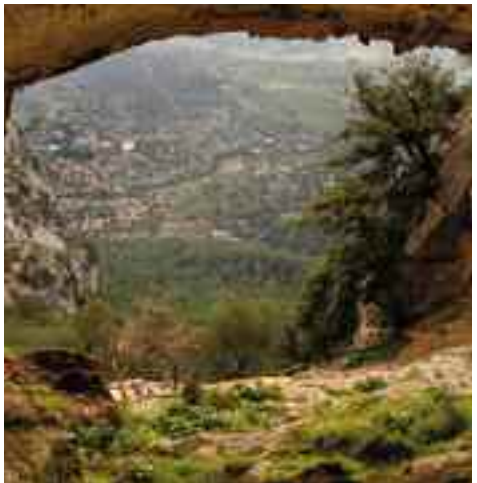
Cova de Sant Antoni

Per a aquells que preten- guin fer part de la pujada amb vehicle, l'alternativa més senzilla és deixar-lo a l'aparcament del restaurant del Verger i agafar el camí del Pouet.