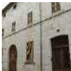
La façana de Can Roua destaca pels seus carreus de pedra viva ben tallats