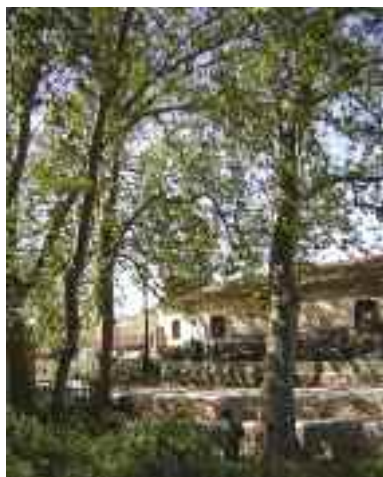
Plàtans de s'Escorxador