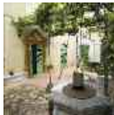
Al pati de tarongers de la Rectoria hi trobam la façana interior, amb un rellotge solar de 1768

XVIII en la qual s'han succeït les reformes, com a la façana exterior, de la qual s'ha extret la coberta de morter tradicional, i s'hi ha deixat la pedra a la vista, amb la qual cosa es distingeixen