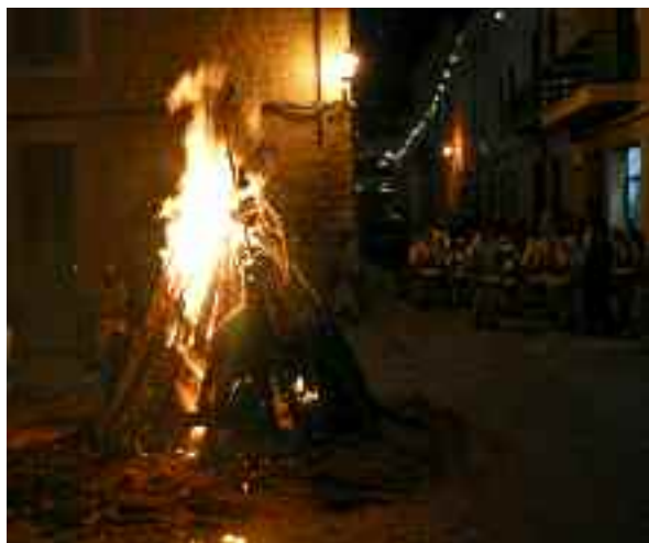
Foguero de la revetla de Sant Antoni