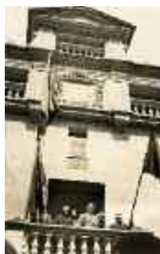
Proclamació de la II República a Alaró

Els aixecaments generalitzats de l'octubre de 1934 no es produeixen a Alaró, però es produeixen detencions i es destitueix el consistori d'esquerres. El cop d'estat posterior a les eleccions de 1936 va donar pas als anys més negres de la història espanyola. Per a Alaró, igual que a la resta d'Espanya,