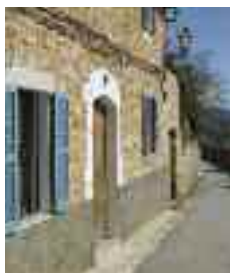
Ses Rotes era una zona de petits trossos que es donaven per cultivar