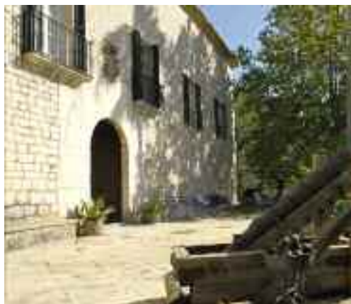
Façana principal de Solleric

Solleric és una de les grans possessions de muntanya i les seves cases van en consonància amb la finca. Se la coneix ja a l'època musulmana, amb el nom d'alqueria Xular. S'esmenta també en els segles XIII i XIV, després de la conquesta catalana, quan es va cedir a la família Guitard.