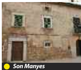
● Son Manyes