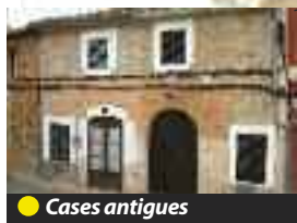
● Cases antigues