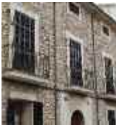
Casal de Can de Haro

correguts, passarem per davant alguns dels casals més sorprenents d'Alaró.