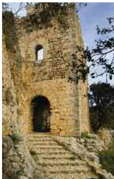
Torre de l'Homenatge o es Constipador

Els moment de major significació del castell d'Alaró varen ser els segles XIII, XIV i XV, que es corresponen amb la dominació de la Casa Reial de Mallorca i la