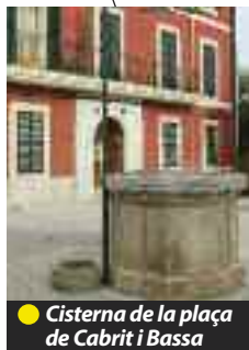
● Cisterna de la plaça de Cabrit i Bassa

En aquesta esplanada, dominada per l'antiga casa quarter de la Guàrdia Civil, es troben les que, molt possiblement, són de les cases més antigues d'Alaró i que remunten el seu origen al gòtic (pl. de Cabrit i Bassa, 8 i 9). Aquestes