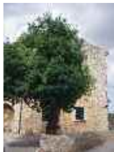
Cases de sa Bastida