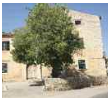
Casal de sa Bastida

A la convergència del carrer de Can Coxetí, d'Enmig i del Porrassar, s'aixeca l'edifici Can Pinoi , un habitatge del segle XVII en el qual des-