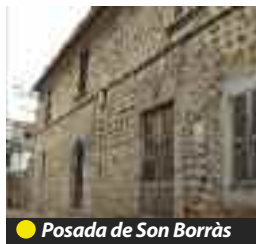
● Posada de Son Borràs