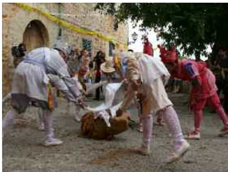
Ball dels Cossiers a los Damunt

L'origen del ball dels Cossiers es antiquíssim, se'ls ha relacionat amb balls arcaics de les cerimònies d'adoració i culte a les divinitats agràries, salvant les evidents mutacions al llarg dels segles, que han influït en els seus vestits, ritmes i organització. Els Cossiers evolucionen i conviuen amb les manifestacions religioses, però també s'han amagat o camuflat per assegurar la permanència els darrers segles. A Alaró el ball es va recuperar el 1992, després de dècades d'oblit.