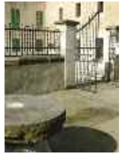
Jardins públics del casal de Son Tugores

d'aquí el sobrenom de Ca s'Indiano: un gran casal aïllat envoltat d'un gran jardí, en el qual destaca una gran araucària ( Araucaria heterophylla ) que supera els cent anys. Els elements florals gravats a la pedra de les mènsules es repeteixen a la llinda dels balcons.