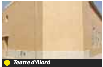
● Teatre d'Alaró