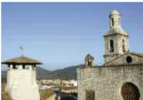
Campanar de l'església i torrassa de l'ajuntament

de l'església, definida per grans volums de pedra nua desornamentats, on els únics elements que destaquen a l'exterior són la rosassa i el portal major, molt habitual en l'arquitectura religiosa del