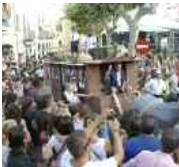
Desfilada de carrosses

Les festes patronals acaben amb un correfoc dels Dimonis a la plaça de la Vila.