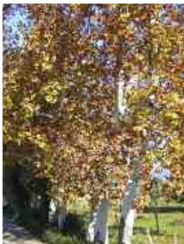
Plàtans de Son Fortesa