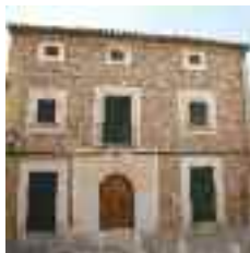
Son Guitard (s. XVIII) ha estat reformada per deixar la pedra de la façana a la vista