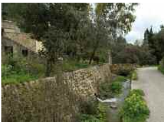
Cases de sa Font des Jardí

Continuant el camí, un poc més amunt, un gran dipòsit descobert