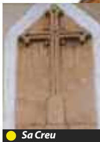
● Sa Creu