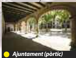
● Ajuntament (pòrtic)