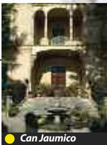
● Can Jaumico