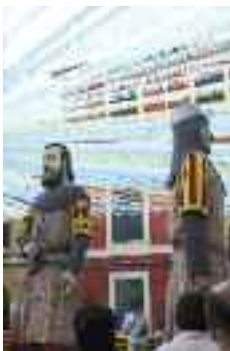
Festes de Sant Pere

L'única forma de gaudir dels balls, veure'n de prop les particularitats i observar els elements més significatius d'aquests curiosos balladors, és assistint a aquestes comptades sortides dels Cossiers d'Alaró.