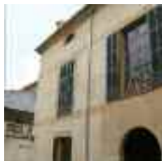
S'Olivaret és un dels majors casals senyorials del nucli urbà del poble