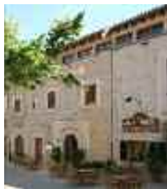
Posada de Can Xalet

Sense sortir de la plaça, al cantó oposat a l'Ajuntament, es localitzen l'hotel Traffic i el restaurant Can Punta, que en realitat conformaren un únic edifici: la posada de Can Xalet (pl. de la Vila, 8 i 9). Les posades eren les cases que els senyors de les grans possessions tenien a les viles i on estaven quan passaven temporades als centres urbans.