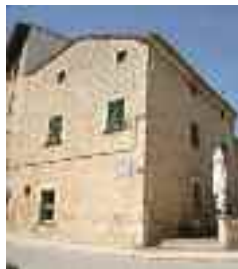
Casal de Son Mallol

La planta baixa ha estat reformada per convertir-se en el bar Acros, punt de trobada del dia i de la nit alaronera, i un restaurant. En la remodelació s'han respectat gran part de la distribució inicial i fins i tot elements decoratius, com les rajoles hidràuliques originals.