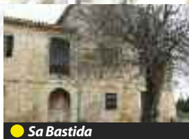
● Sa Bastida

Son Rafalet, a mà esquerra, un element il·lustra novament l'entramat d'abastiment d'aigua: els rentadors de Son Rafalet. Aquesta bugaderia pública, construïda en el segle XIX, s'abastia de l'aigua de la font de ses Artigues i hi acudiren durant dècades les dones del poble a rentar-hi els draps bruts... (expressió que fa al·lusió a la neteja de la roba i a l'expressió figurativa). Es tracta d'una pica amb tres compartiments interiors, feta de pedra i estucada en blanc. La coberta de