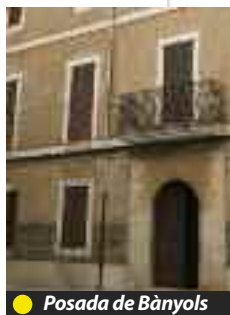
● Posada de Bànyols