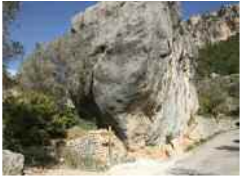
Primers trams del camí de pujada

La dreuera continua ascendint entre oliveres i pinar, traçant voltes que proven de reduir la duresa del desnivell de la pujada creuant diverses vegades el camí rodat fins que l'abandona definitivament alguns centenars de