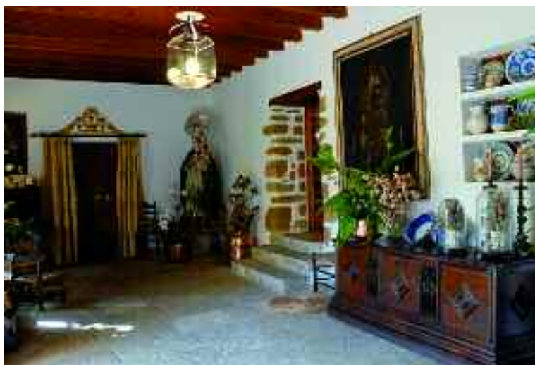
Interior de les cases de Son Penyaflor

en bloc, es divideixen en tres volums annexos: el central, de menor profunditat, proporciona certa irregularitat a la línia de la façana, on el cos principal apareix reculat respecte de la resta. Les cases tenen tres pisos: planta baixa (casa dels amos), primer pis (planta dels senyors) i el porxo.