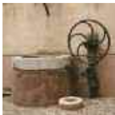
La manxa del carrer de Can Pintat és de planta circular i disposa d'una roda de ferro