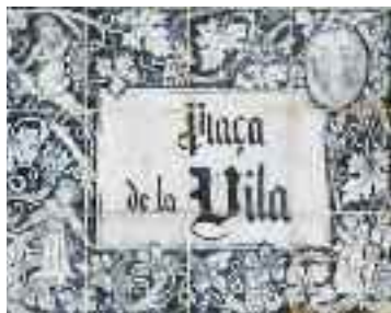
Els carrers d'Alaró estan indicats amb plaques elaborades artesanalment