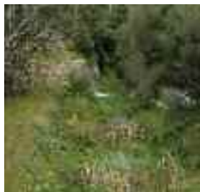
Torrent de s'Estret

No s'ha d'abandonar el camí fins a haver travessat la finca de Ca na Magdalena . Deixant la barrera a mà esquerra, des de la qual arranca el camí privat cap a les cases, seguint el camí original i a poc més de 100 m, s'obre un camí-