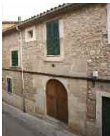
Casa de ses Caves o Can Morro

Finalment, prenent el carrer de Can Ros, en el número 25 s'aixeca l'edifici Can Roua (o Can Jaumico). La seva façana destaca pel material i la tècnica de construcció: tot el parament és de carreus de pedra viva ben tallats i disposats re-