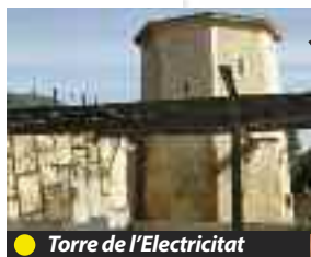
● Torre de l'Electricitat