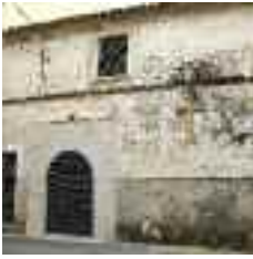
Can Pinoi és una casa del segle XVII de la qual destaca el seu portal de pedra