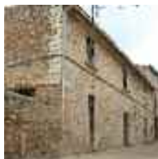
Son Borràs és un casal del segle XVI que era l'antiga posada de la possessió del mateix nom