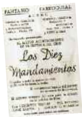
Cartell d'una projecció cinematogràfica a Alaró

saren en funcionament la primera sala de cinematografia de Mallorca el 1903. Durant un temps es va reunir a Alaró públic vingut de tota l'illa per gaudir de la programació, ja que fins anys després no s'inauguraren sales similars a Palma i altres municipis.