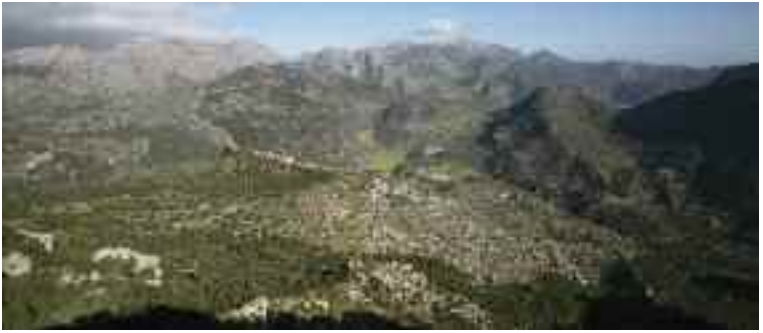
Vista de la serra de Tramuntana des del mirador de l'Orengar

seva posterior incorporació a la Corona d'Aragó. La fortificació va ser progressivament abandonada, encara que es va mantenir una guarnició militar fins al 1741. A pesar dels esforços, la majoria de les torres medievals no han resistit el pas del temps i es troben mig esbucades sense que s'hi hagin realitzat tasques de rehabilitació recents o d'excavació arqueològica.