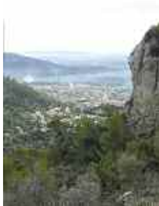
Vista d'Alaró des de sa Bastida

elements que referencien la invasió i el posterior assentament vàndal del regne africà de Genseric (segle V).