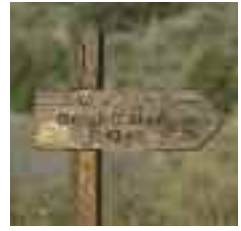
La pujada al Castell és una de les excursions més espectaculars d'aquesta zona

Si el caminant no ha trobat l'antiga sendera i ha seguit la pista moderna, un poc més endavant, just després de la paret amitgera que divideix les finques de Son Penyaflor i es Verger , s'ha emplaçat un indicador que el reconduirà de la pista de ciment cap a la via original.