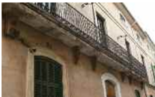
Casal del carrer de Jaume Colom

ses Barreres, connectat amb el carrer de la Mare de Déu del Refugi i girant cap al carrer del Metge Jaume Colom, ja només