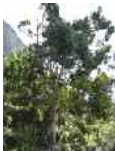
Eucaliptus de sa Bastida

El pi de Son Guitard és un exemplar de pi blanc ( Pinus halepensis ) extraordinari per la seva mida i edat, conegut i estimat per la població d'Alaró. Les seves mides: 23 m d'alçària amb la capçada i 4,50 m de circumferència, i se li calcula una edat entre 250 i 300 anys. El nom li proporcionen les cases on es troba, la finca de Son Guitard. Es tracta d'un exemplar protegit i catalogat des de 1992.