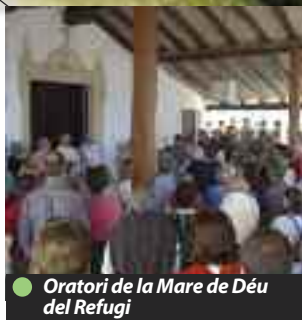
● Oratori de la Mare de Déu del Refugi