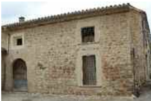
Casal de Son Vidal

Pujant la costa de Son Sitges, a mà dreta comença el carrer de sa Gerreria, que arriba a continuació,