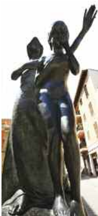
Escultura "Retorn al bon camí" de Llorenç Rosselló

Després d'aquesta escultura, en un altre dels cantons de l'esplanada, es situa el casal de Son Mallol (pl. de la Vila, 14). Aquesta és una casa de possessió absorbida pel poble, els detalls de la qual es remunten al segle XVI. Entre altres elements destaquen els finestrals del casal, arquivats amb peces de pedra amb decoració conopial, i la petita finestra atrompetada del lateral del casal. Una porta annexa del casal acollia l'última tafona que va estar en funcionament d'Alaró, l'estructura de la qual encara es conserva en part.