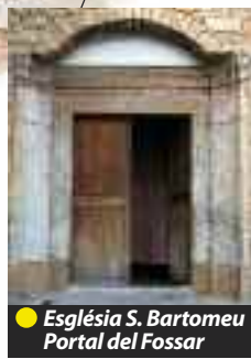
● Església S. Bartomeu Portal del Fossar

segle XVII. Els murs compten amb més de 20.000 carreus de pedra tallada.