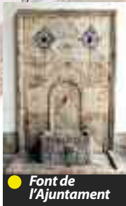
● Font de l'Ajuntament