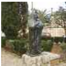
En el centre de la plaça del Mercat trobam una escultura de l'artista Solveig Pripp