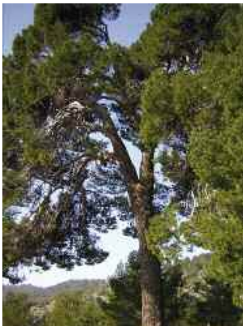
Pi de Son Guitard

Es tracta d'un exemplar sa i espectacular d'un arbre forà poc habitual a les Balears, un eucaliptus ( Eucalyptus globulus ). Les dimensions de l'arbre se situen al voltant dels 18 m d'alçària i més de 2 m de diàmetre de tronc. Es localitza devora l'antic hort de la font de sa Bastida. La seva edat s'estima al voltant dels 100 anys.