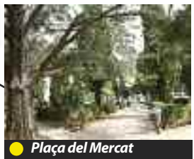
● Plaça del Mercat