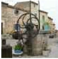
A la zona del Porrassar trobam una cisterna o carregador de forma octogonal