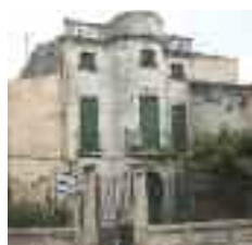
Casal racionalista del carrer de Can Ros