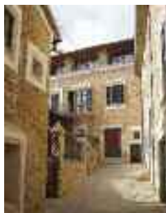
Carreró de Son Bieló

girant a mà esquerra, al passatge de sa Gerreteria , un racó preciós per explorar, dels molts que es poden trobar al nucli antic. Es reprèn el carrer de Son Sitges per dirigir-se a Son Bieló (c. de Son Sitges, 11), un casal que tenia un altre dels molins d'aigua –del qual resten vestigis–, que, com l'anterior, formava part de l'antic sistema hidràulic d'Alaró. Aquest casal del segle XVIII exhibeix un