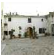
El barri de Los Damunt és el nucli urbà inicial d'Alaró, referenciat des de 1395. Les reduïdes dimensions d'aquest nucli possibiliten un agradable i breu passeig pels seus carrers principals