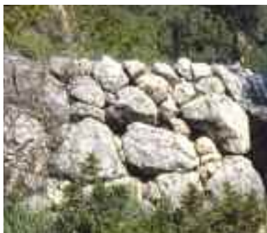
Claper des Gegant

L'estructura de la construcció la conformen grans blocs irregulars, escassament retocats i toscament encaixats entre si, la qual cosa sembla que indica que es varen extreure de les proximitats del talaiot i que no es treballaren gaire.