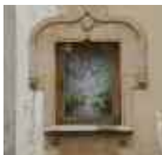
● Capella de Cabrit i Bassa

i Bassa o plaça de los Damunt s'obre pas la història o el mite, atès que es diu que en aquest punt és on els herois locals varen ser executats de forma cruel pel rei Alfons II d'Aragó.