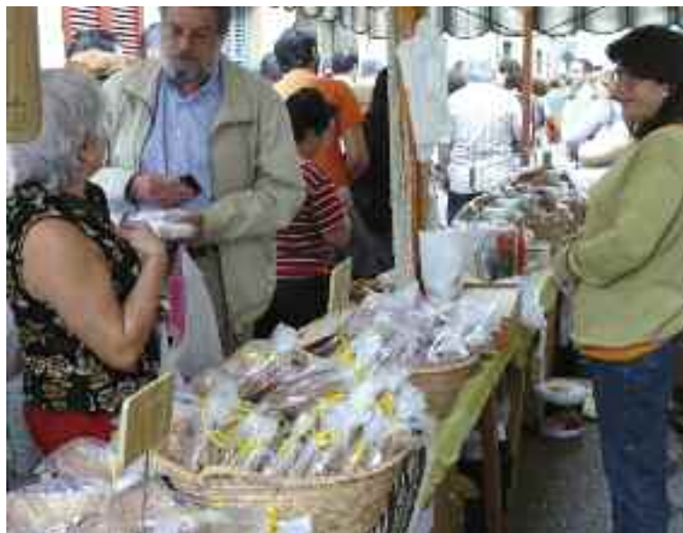
Punt de venda artesanal de la fira de tardor