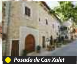
● Posada de Can Xalet