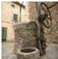
Davant el casal de Son Manyes hi ha un racó amb una cisterna amb solera redona