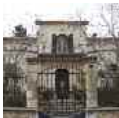
Els Casals és un edifici que permet apreciar un altre exemple d'arquitectura modernista