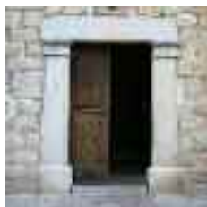
Portal de Sant Antoni, que dóna accés al carrer del Campanar