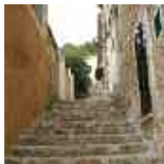
El passatge de sa Gerreria és un preciós racó que ens condueix fins a la zona de ses Rotes

Entre les característiques que defineixen la majoria dels portals principals d'Alaró, hi ha les llindes de gran entitat, lloses de pedra en els sòcols i marès o pedra en els marcs d'obertures i llindars. En alguns casos, s'hi ha esgrafiat una creu al centre o lateral, o la lletra grega tau, símbol de sant Antoni Abad.