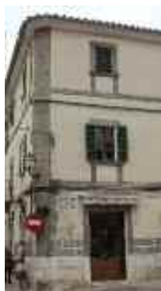
Cantonada entre els carrers de Can Ros i Jaume Colom

gularment al llarg de la façana units per juntes molt estretes, un exemple quasi únic a Alaró. Va ser la primera casa Can Jaumico que després es va transformar en fàbrica de sabates, i posteriorment en una granja de pollastres i conills. Avui dia reconvertida novament en una casa particular i bar