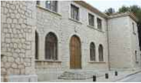
L'Escola Graduada s'inaugurà el 1934 i fou el símbol a Alaró de la II República espanyola