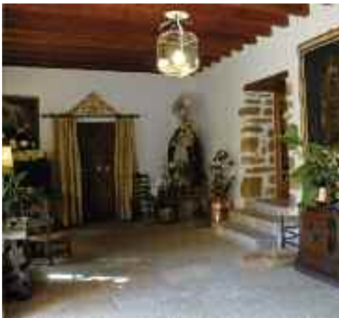
Clastra de Son Penyaflor

En aquesta darrera etapa de via empedrada, el viatjant podrà gaudir d'unes magnífiques vistes sobre el municipi i els voltants. En l'escarpada paret de colors vermellencs (la sang vessada dels musulmans que defensaven el castell segons la llegenda), a l'esquena del visitant, s'enfila una nombrosa col·lecció d'endemismes i vegetació autòctona que fascinarà els naturalistes.