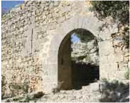
Porta principal del Castell d'Alaró

Malgrat que la conquesta va ser finançada pels principals prelats i magnats de Catalunya, altres poblacions de Provença (actualment França) o Ligúria (actualment Itàlia) també hi participaren, com també les ciutats