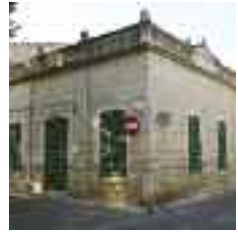
Casal de tendència art déco colonial del carrer de Can Cladera