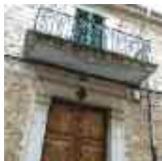
Can Marrigo és un casal del segle XVII, del qual destaquen el portal i el balcó de ferro

l'austera façana, les reixes del tancament exterior amb decoració floral, les baranes de terrasses i balcons, i en general, l'aparició del ferro com a element estructural i decoratiu.