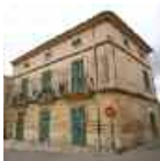
Al casal de Can Pere Ric (s. XIX) destaca l'acurada execució d'elements decoratius